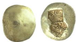
Πρώτο νόμισμα, 630-600 π.Χ.

Με βάση τη διαδραστική, βιωματική και ανακαλυπτική μάθηση, το Πρόγραμμα ξεκινά με διαλογική συζήτηση και με τη χρήση εποπτικού υλικού για την εμφάνιση και την απαρχή του νομίσματος στον αρχαίο ελληνικό κόσμο. Παρουσιάζονται το πρώτο νόμισμα της ιστορίας (ήλεκτρο Ιωνίας/Λυδίας, το πρώτο νόμισμα που εκδόθηκε στον ελλαδικό χώρο (στατήρας Αίγινας) και το πρώτο διεθνές νόμισμα (τετράδραχμο Αθηνών).