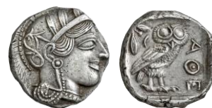
Τετράδραχμο Αθηνών, 440-420 π.Χ.