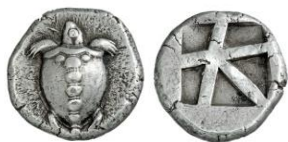
Στατήρας Αίγινας, 470-440 π.Χ.